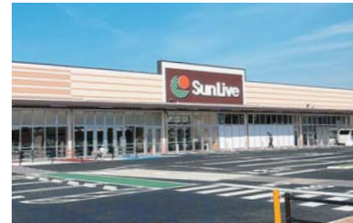
●サンリブ清水[今秋再開](約600m)

【お支払い例】 ●弊社提携銀行金利利用●10年固定金利●金利1.25%●35年元利均等払い※別途諸経費が必要になります。