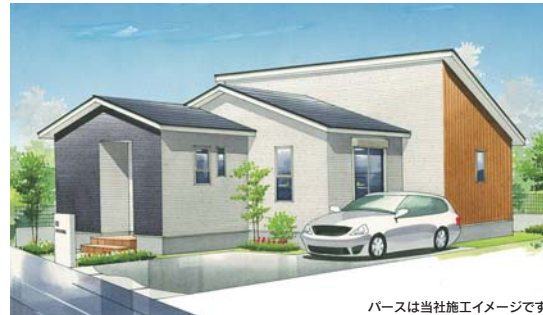
パースは当社施工イメージです

サンリブ清水へ徒歩約8分。 北バイパスと電鉄(新須屋駅徒歩約9分)で 便利なアクセス。光の森も買い物圏内。