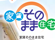
千里殖産八代住宅展示場 家賃そのまま住宅

このハガキをご持参いただいたお客様へ Quoカード 1,000円分 プレゼント!! アンケートにご協力いただきます。