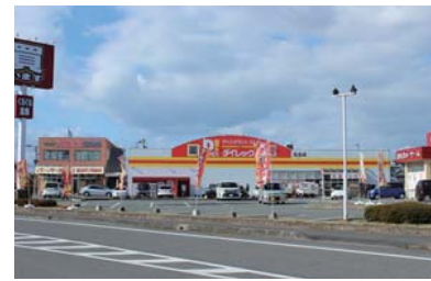
●国道208号線沿いのショッピングゾーン(約1,000m)